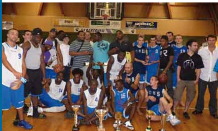
Les finalistes du tournoi David Hoareau 2010